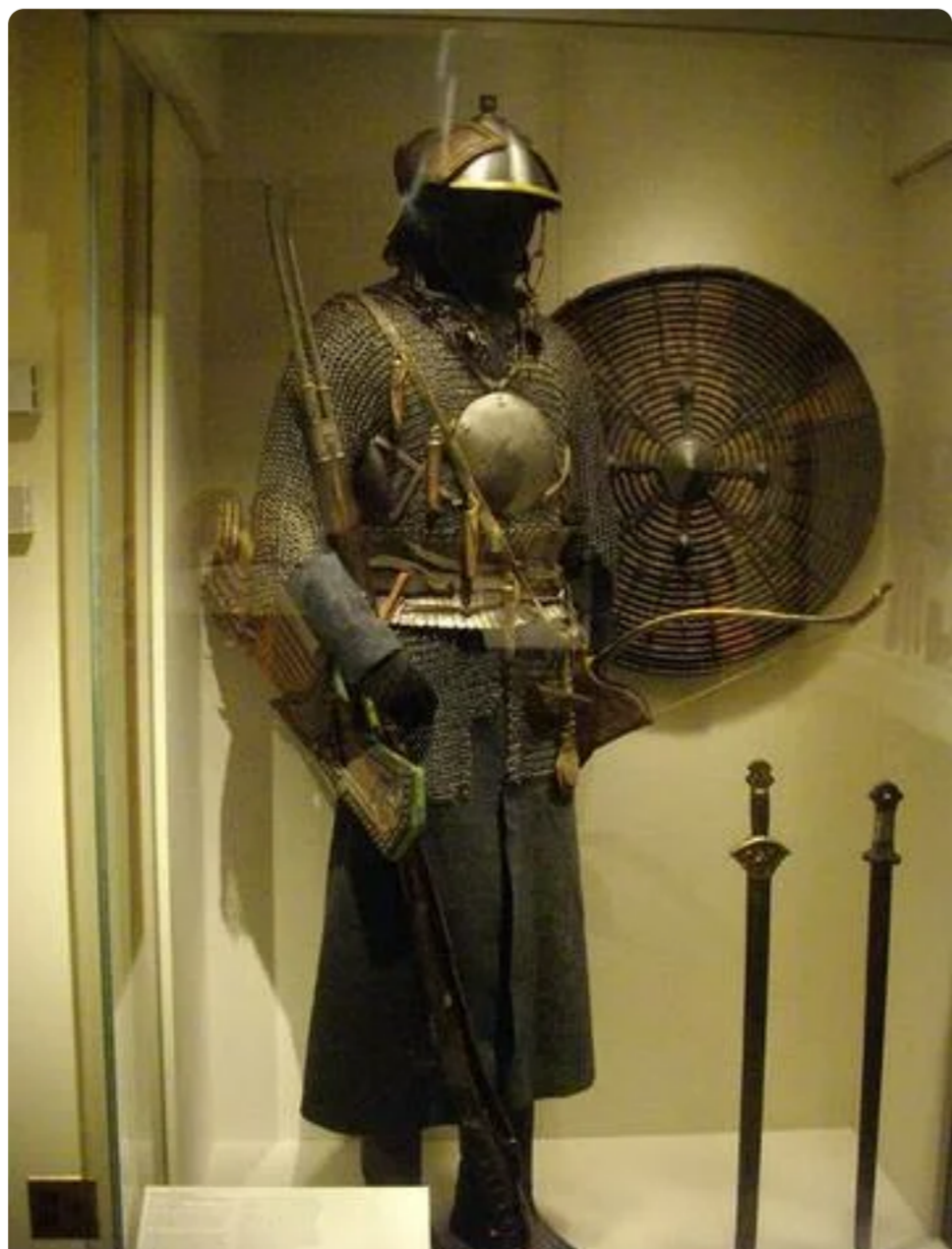
Доспехи дзурдзуков ( нахов )

Потомки Бёрта после отражения нашествия монгол спустились на равнину и предгорную местность, где основали село Ганжуево ( Ломаз-Юрт) и Алхазурово ( Олхазар-Клотар ).